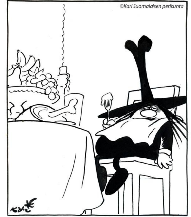
Kuva: Kari Suomalainen 1965

Joulun herkkuja pullollaan on helppo tehdä uudenvuodenlupaus laihdutuskuurista tai keveämmästä ruokavaliosta. Helpostihan sitä muutaman kilon tiputtaa ja samalla mielikin virkistyy. Parin kiireisen ja kevyesti syödyn päivän jälkeen idea ei tunnu ihan helpolta toteuttaa ja tosissaan tehty päätös alkaa hiipua aikomukseksi. Mieleen hiipii epäily, että missä vika, kun dieetti alkaa tuntua niin ankealta.